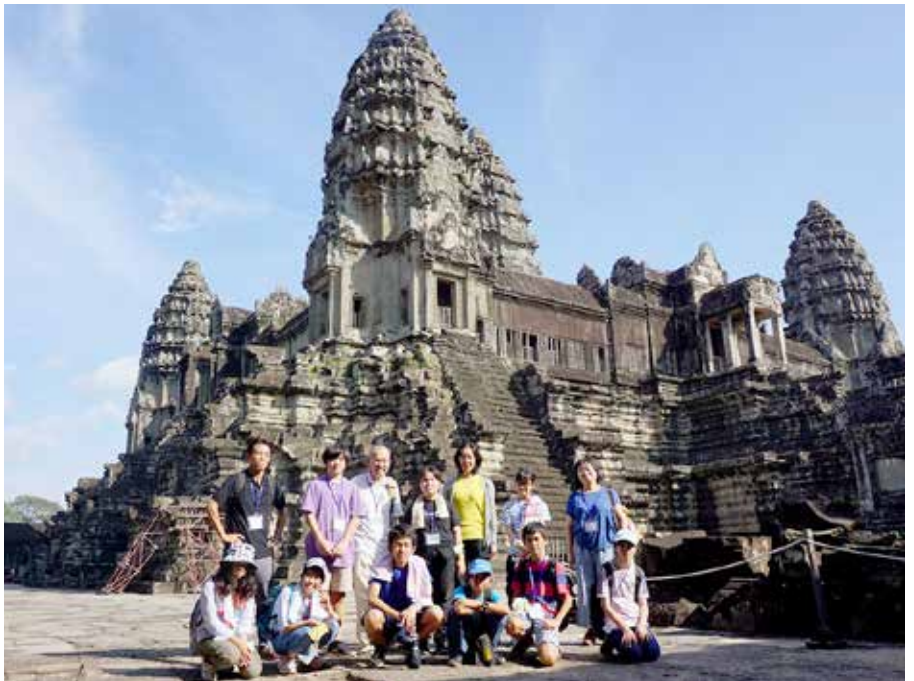
▲ アンコールワットへ修学旅行

私のダラスへの赴任は、2015年から2018年まででした。ちょうどその頃は、北米トヨタ(TMNA)がプレイノに新たに設立されたり、テキサス新幹線構想実現に向けてJR東海の関係者がダラスに来られたりと補習校生徒の急増期でした。それに伴い教員不足、学校駐車場不足が顕在化してきました。新規採用教員の採用面接を年度