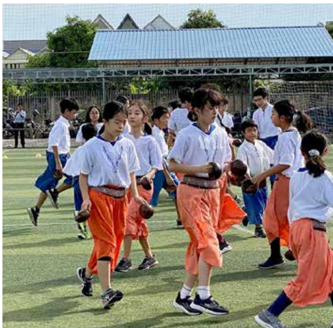
▲ 運動会の様子。カンボジアの民族踊りココナッツダンスはプノンペン日本人学校の伝統に。