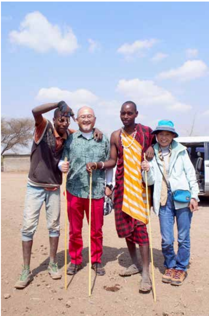
▲ タンザニアにて。マサイ族のマーケット観光