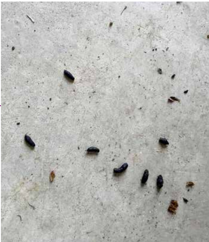
▲ ガレージ床ネズミのフン

ダラス近辺で、野ネズミはどこにでもいる野生動物です。毒入りの餌で駆除だけしても、またどこからかやってきます。侵入経路を絶つのは絶対に必要な対策です。持ち家の方はこの事例を参考にしてください。借家の方も、何か気配があったら大家さんか管理会社の方にご相談ください。しつこくお願いしてしっかり駆除してもらいましょう。