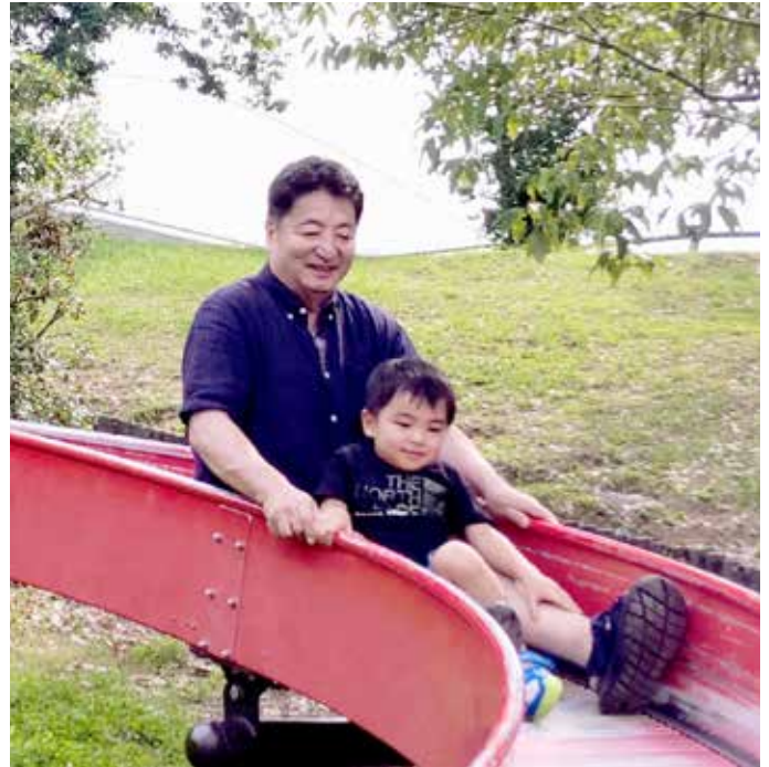
▲ 最大の楽しみ。3歳の孫との時間

海外子女教育振興財団委嘱の「在外教育施設の高度グローバル人材育成拠点事業(AG5)」では、教員の指導力向上や生徒の学力向上に微力ながらも関わり、充実した2年間を送ることができた。また、学校創立50周年を迎える準備の中で、日本人会をはじめ保護