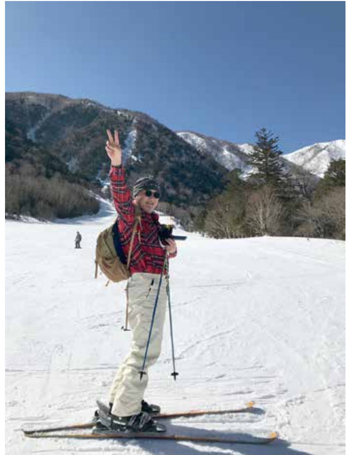
▲ 奥日光へ3年振りのスキー

現在も時折、補習校勤務時の同僚や知人からLineやE-Mailをいただき懐かしく思っています。たった1年7カ月のDallasでの生活でしたが街の様子、アパートで