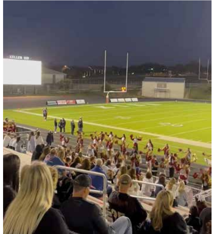
▲フットボール専用グラウンド