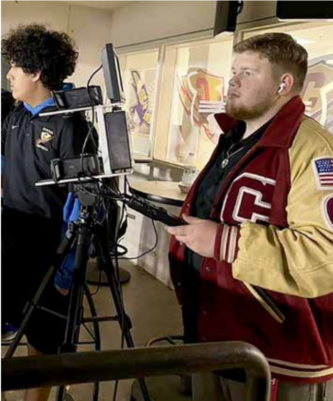
▲カメラを操作する高校生