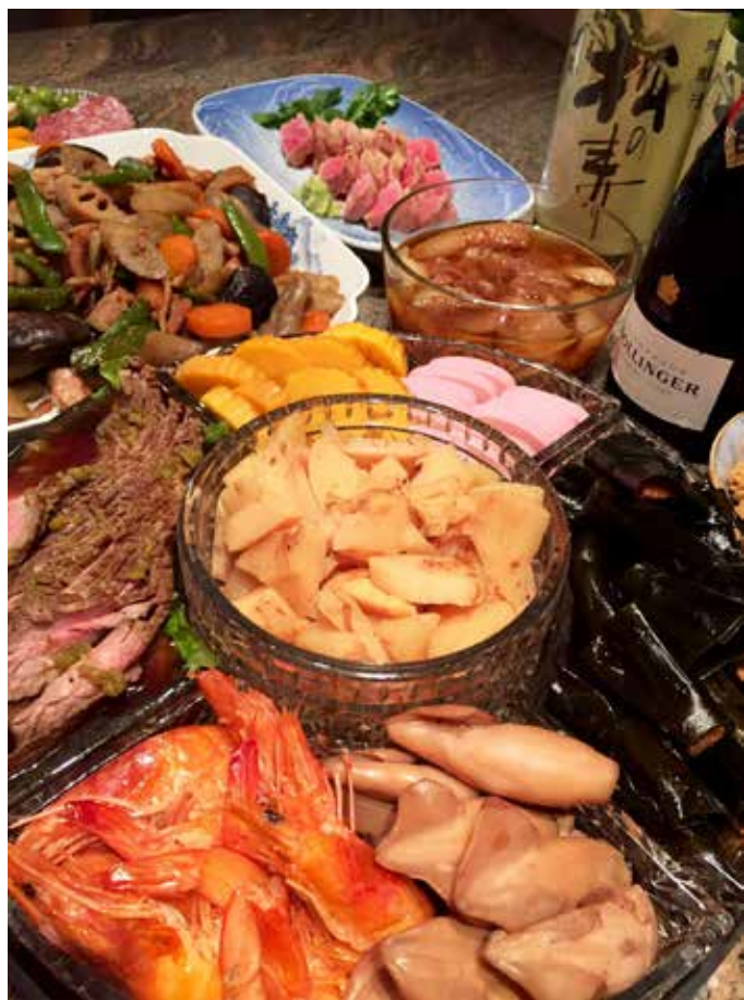
▲ 昨年我が家で作ったおせち料理

関西の方では角餅ではなく、丸餅をお雑煮として食べるようですが、お雑煮は餅の形だけでなく、中身も味も地方によって千差万別です。私は愛知県の出身ですが、餅菜と鰹節(削り粉)を入れただけの名古屋のお雑煮は日本一簡素なものとして知られています。我が家では祖母もしくは母が火鉢で餅を焼き、さすがに餅