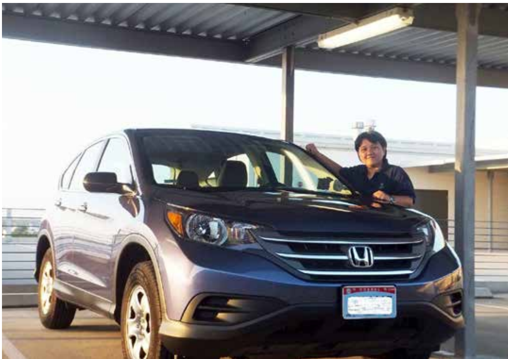
▲ クニカネ号と筆者

2016年5月から7年半もの長きにわたり拙稿をお読みいただき誠にありがとうございます