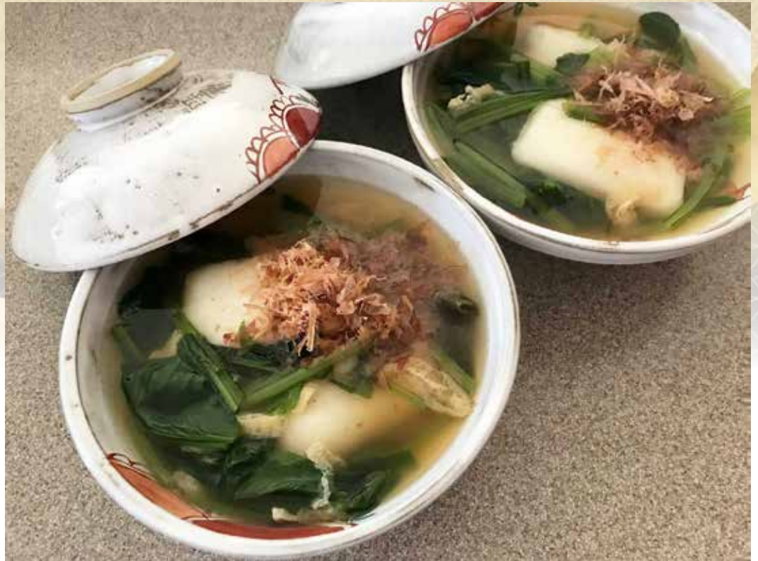
▲ 典型的な名古屋の簡素なお雑煮