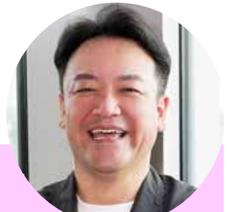
司会 たむらけんじ