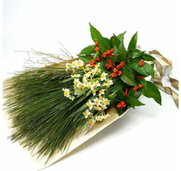
▲ 幸せを束ねたような冬のブーケ (AOYAMA HANAMO)