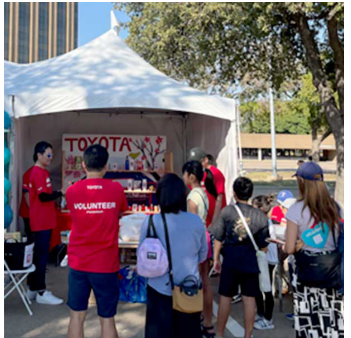
▲ 大人気の射的の様子