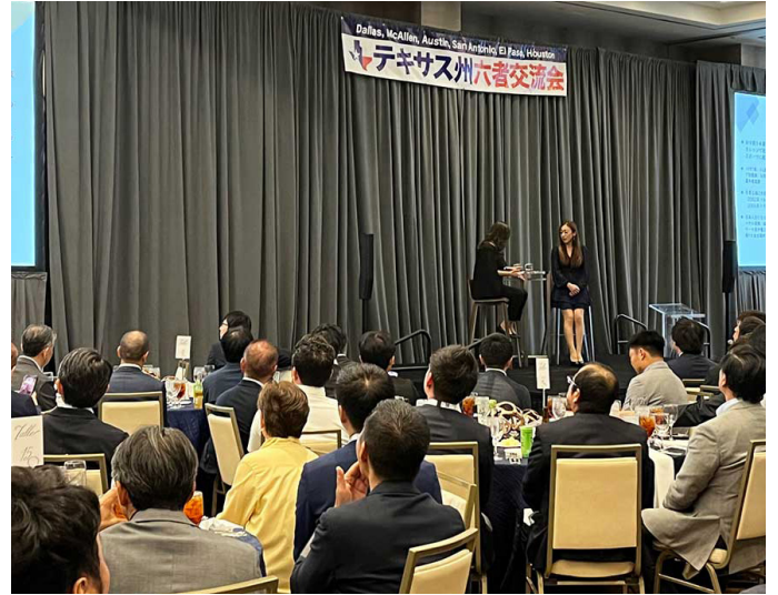
▲ 講演会・懇親会様子

地元ダラスでの次の六者交流会開催は2030年の予定となりますが(毎年六都市の持ち回り開催のため)、次の6年でダラスがどこまで進化を遂げ、各都市にどのような新たな魅力を発信できるか大変楽しみです。